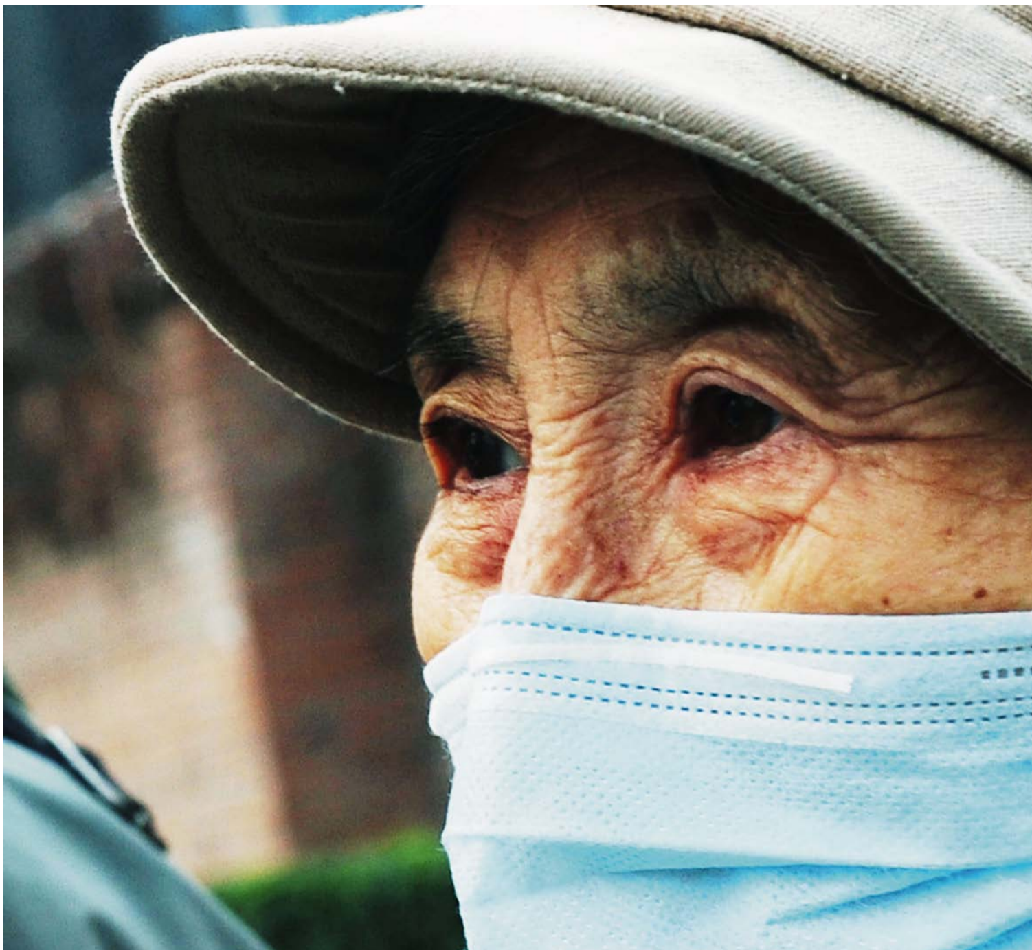
FLERE HINDRE: En aldrende befolkning og økende miljøproblemer er blant grunnene til at Kina neppe vil klare å nå igjen USA.

Mer alvorlig for vekstevnen er begrensningene det politiske systemet setter for fri flyt av informasjon og fri forskning. Skal Kina bevege seg oppover verdikjeden, og det må Kina om næringslivet skal