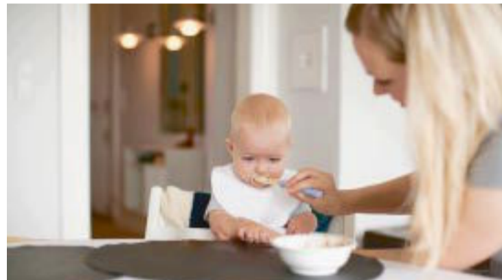
KAN BLI NEDPRIORITERT. Det kvinner kan velge bort, er å få barn. Det har man sett i land med dårligere familiepolitikk.

Det kvinner derimot kan velge bort, er som nevnt å få barn. Det har man sett i land med dårligere familiepolitikk. Vi får vel neppe italienske tilstander for norske kvinner, men mulighetene for å lykkes i mannsdominerte yrker vil i