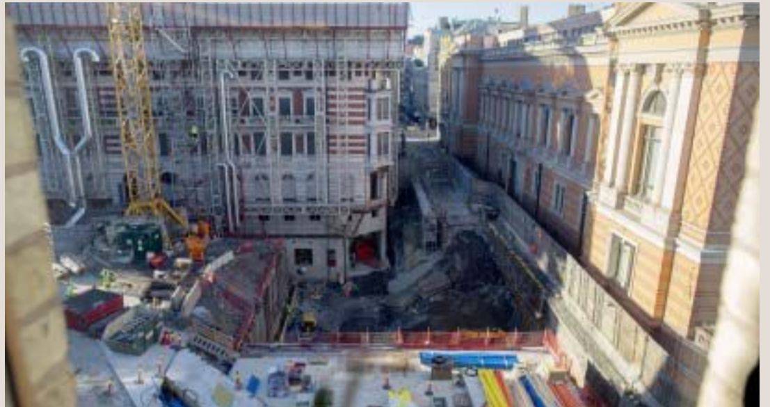
Uten veksten fra offentlig sektor og fra bygg og anlegg ville veksten på fastlandet ha falt med nesten 0,7 prosent siste året. Her fra byggearbeid ved Stortinget i Oslo.